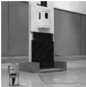
Abbildung 1: Versuchsaufbau an der Empa Dübendorf zur Ermittlung der Erker-Wirkung.

Um auch an dieser lärmbelasteten Strasse (65 dB) einen hohen Wohnkomfort sicherzustellen, sind spezielle Massnahmen notwendig. Deshalb wurden eigens Schalldämm-